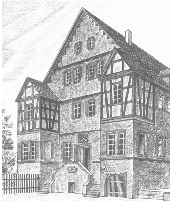
Titel: Treppe mit Wappen, Inschrift „Hartlieb 1630 Hatzfeld“, Foto: Dittrich Rückseite: Junkernhof von SO, Federzeichnung von Peter Nieß

Quelle: Der Junkernhof, Brutstätte des Hexenwahns., In: Dr. Walter Nieß, Büdingens keltische Wurzeln, Geschichtswerkst. Büdingen, 2008.